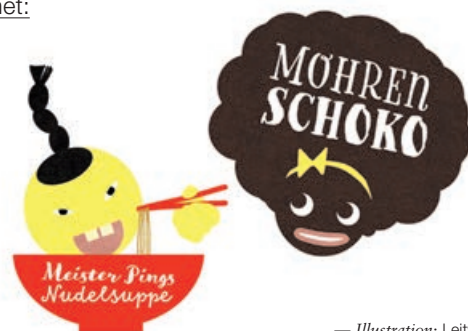
— Illustration: Leitwerk

♀ steht für die weibliche Form des vorangegangenen Begriffs