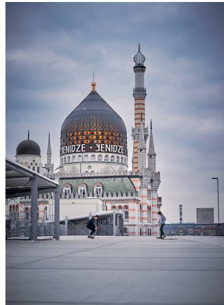
Abb. 2, ehem. Fabrikgebäude für Tabakwaren „Yenidze“ in Dresden, erbaut Anfang des 20. Jh. im orientalisierten Stil

Stenske: Muslimisches Leben in Ostdeutschland prägt eine andere Geschichte als in Westdeutschland. Damit unterscheidet sich auch die Zusammensetzung der muslimischen Bevölkerung in Ost und West. Ersterer sind häufig im Zuge von erzwungener Migration und Flucht nach Deutschland gekommen, letztere blicken auf eine Migrationsstruktur besonders geprägt durch Anwerbeabkommen zurück. Auch das organisierte religiöse Leben unterscheidet sich: Muslimische Dachverbände sind in Ostdeutschland in deutlich geringerer Zahl vertreten. Auch Anlaufstellen für von Rassismus betroffene Menschen sind in Ostdeutschland weniger zu finden. Es gibt in den neuen Bundesländern keinen islamischen Religionsunterricht. Christoph Gümmer beschäftigt sich in seinem Beitrag dezidiert mit einzelnen Gemeinden in Leipzig und Martin Zabel mit einer Gemeinde in Rostock. Beide stellen fest, dass Muslim*innen zwar bereits in der DDR ihre Religion öffentlich praktiziert haben und dabei vom Staat auch geduldet wurden. Es handelte sich dabei aber um Einzelfälle, in der Regel wurden keine Selbstorganisationen wie in Westdeutschland gegründet. Das ist ein Grund, weshalb heute deutlich weniger Gemeinden in Ostdeutschland in Besitz von eigenen Räumen sind. Moscheegemeinden in Ostdeutschland müssen im Gegensatz zu vielen Gemeinden in Westdeutschland ihre Räume mieten. Ayşe Almıla Akca hat in ihrem Beitrag einen guten Überblick über einige dieser Aspekte geschrieben.