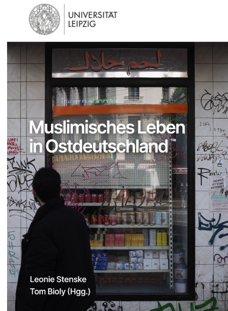
Abb. 3, Cover des Sammelbandes von Stenske/Bioly (2021)

Hierin wird die Idee des*r formbaren und manipulierbaren Muslim*in deutlich. Dem liegt eine Vorstellung vom Islam als primitiver Religion zugrunde, die auf einfachen Grundsätzen von Freund-Feind beruht. Wie wurde nun der Islam in der DDR gesehen? Auch in der DDR wurde eine Minderwertigkeit des Islams konstruiert – es hieß, dass der Sozialismus in Ländern wie Ägypten über die Religion triumphiert habe. Dieses Narrativ änderte sich erst in den 1970er/80er-Jahren, als der Islam plötzlich als Gefahr wahrgenommen wurde. Dies hängt mit politischen Entwicklungen wie z. B. der Iranischen Revolution zusammen.