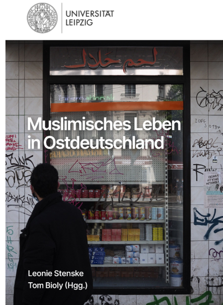
Abb. 3, Cover des Sammelbandes von Stenske/Bioly (2021)

Dies hängt mit politischen Entwicklungen wie z. B. der Iranischen Revolution zusammen.