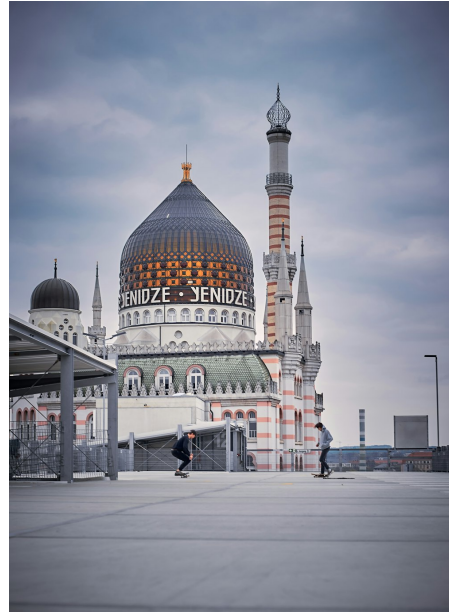
Abb. 2, ehem. Fabrikgebäude für Tabakwaren „Yenidze“ in Dresden, erbaut Anfang des 20. Jh. im orientalisierten Stil

Stenske: Muslimisches Leben in Ostdeutschland prägt eine andere Geschichte als in Westdeutschland. Damit unterscheidet sich auch die Zusammensetzung der muslimischen Bevölkerung in Ost und West. Ersterer sind häufig im Zuge von erzwungener Migration und Flucht nach Deutschland gekommen, letztere blicken auf eine Migrationsstruktur besonders geprägt durch Anwerbeabkommen zurück. Auch das organisierte religiöse Leben unterscheidet sich: Muslimische Dachverbände sind in Ostdeutschland in deutlich geringerer Zahl vertreten. Auch Anlaufstellen für von Rassismus betroffene Menschen sind in Ostdeutschland weniger zu finden. Es gibt in den neuen Bundesländern keinen islamischen Religionsunterricht. Christoph Gümmer beschäftigt sich in seinem Beitrag dezidiert mit einzelnen Gemeinden in Leipzig und Martin Zabel mit einer Gemeinde in Rostock. Beide stellen fest, dass Muslim*innen zwar bereits in der DDR ihre Religion öffentlich praktiziert haben und dabei vom Staat auch geduldet wurden. Es handelte sich dabei aber um Einzelfälle, in der Regel wurden keine Selbstorganisationen wie in Westdeutschland gegründet. Das ist ein Grund, weshalb heute deutlich weniger Gemeinden in Ostdeutschland in Besitz von eigenen Räumen sind. Moscheegemeinden in Ostdeutschland müssen im Gegensatz zu vielen Gemeinden in Westdeutschland ihre Räume mieten. Ayşe Almıla Akca hat in ihrem Beitrag einen guten Überblick über einige dieser Aspekte geschrieben.