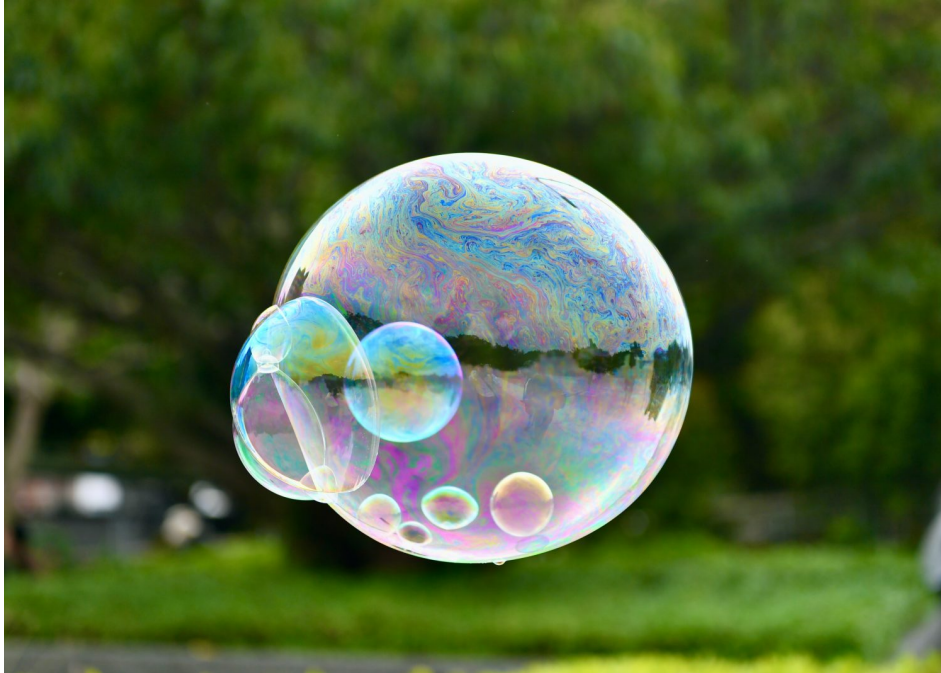
Abb. 1, Symbolbild Filterblasen