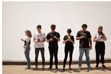
Abb. 7: Jugendliche auf der Suche nach Orientierung

„Ich finde, [bei] Fake News ist immer schwer zu sagen: ‚Okay, das ist jetzt falsch.‘ Aber in der Corona-Krise gibt es ja immer zwei verschiedene Seiten. Und wenn man googelt – ‚okay, so und so ist es passiert‘ – weiß man ja im Prinzip nicht, ob es wirklich so passiert ist, wenn man nicht haargenau dabei gewesen ist“ (11EI, 47:54ff.).