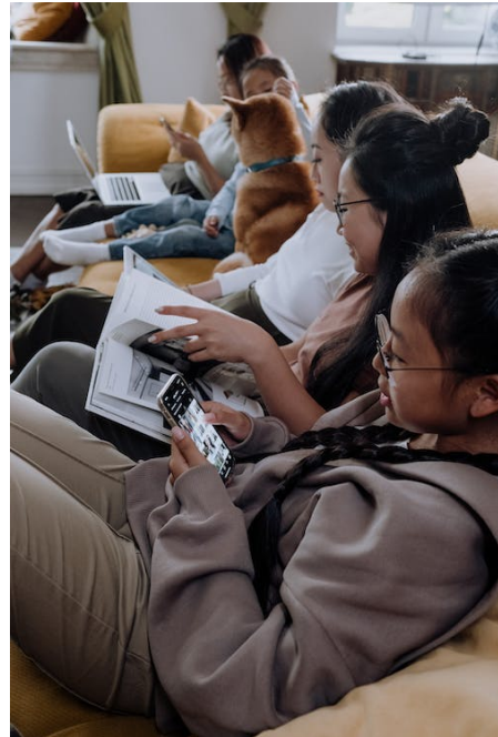
Abb. 4: Informationshandeln von Jugendlichen, Symbolbild