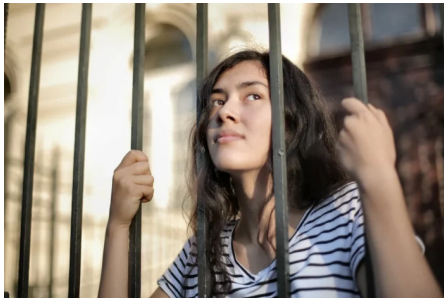
Abb. 6: Jugendliche in der Krise, Symbolbild

„Und dann habe ich zufälligerweise auf TikTok eine [Person] gesehen, die meinte: ‚ So, ja, wenn du dich so und so [...] fühlst, ist es vielleicht ein Zeichen dafür, dass du compulsory heterosexuality [erfährst].‘ [...] [D]adurch, dass halt diese Videos veröffentlicht wurden, waren da halt Kommentare, bei denen man gesehen hat: ‚ Oh, denen geht es genauso.‘ Da sind ganz viele, denen es genauso geht [...]. Und das fühlt sich halt einfach schön an, so zu wissen: ‚ Hey, ich denke nicht als einziger Mensch so‘ (9EI, 15:12ff.).