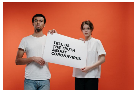
Abb. 2: Während der Coronapandemie war Orientierung für viele sehr herausfordernd.

„Ich finde, Fake News ist immer schwer zu sagen: ‚Okay, das ist jetzt falsch.‘ [Weil] in der Corona-Krise gibt es ja immer zwei verschiedene Seiten. Und wenn man googelt ‚okay, so und so ist es passiert‘, weiß man ja im Prinzip nicht, ob es wirklich so passiert ist, wenn man nicht haargenau dabei gewesen ist. [...] Aber wenn jemand anders mir das sagt, kann ja immer was dazu gedichtet sein oder nicht. Also kann ja auch bei einer ganz normalen oder bei einer guten Quelle, wie ARD zum Beispiel, wenn die News darüber bringen, kann’s ja auch mal – also klar recherchieren die und so, aber es kann ja auch mal falsch übertragen werden“ (E111, 47:54ff.).