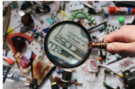
Abb. 4: Für Faktenchecks gibt es verschiedene Methoden.

In der medienpädagogischen Praxis spielen die großen politischen Themen – z. B.: Woher kam das Corona-Virus? – jedoch nur bedingt eine herausragende Rolle. Denn die großen Themen sind häufig derart umstritten und diffus, dass sie den Aufbau einer vertrauensvollen und offenen Kommunikation besonders für externe Fachkräfte erschweren. Um diese Schwierigkeiten zu verringern, haben wir im Projekt eine Methode entwickelt, die Faktencheck und Lebensweltorientierung miteinander kombiniert.