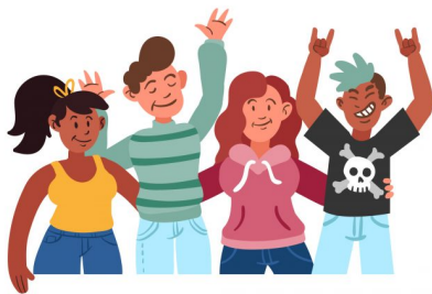
Abb. 3: Symbolbild Jugendliche.

Die Zielgruppe von Isso! sind Menschen zwischen 14 und 26 Jahren, die von außerschulischer Bildungsarbeit bisher nur schwer erreicht wurden. Die Arbeit im Projekt konzentriert sich in großen Teilen auf die Besucher*innen offener Formate in der Jugendarbeit.