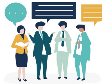
Abb. 6: Bewertungskriterien für Information gemeinsam mit anderen reflektieren.

Mit der eben beschriebenen Projektarbeit werden verschiedene Dimensionen von Medienkompetenz gefördert: die reflexiv-kritische in der Auseinandersetzung mit den eigenen Werten und denen des eigenen Umfelds sowie die soziale Dimension, wenn auch kontroverse, wertbezogene Aushandlungsprozesse verständigungsorientiert durchlaufen werden können (Digitales Deutschland 2020, S. 6).