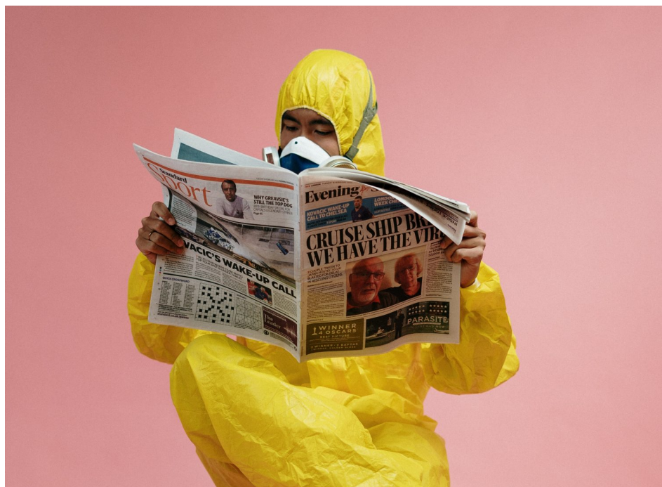
Abb. 1, Symbolfoto, Quelle: Pexels

von Georg Materna, Sonja Breitwieser und Maral Jekta (Isso-Team!)