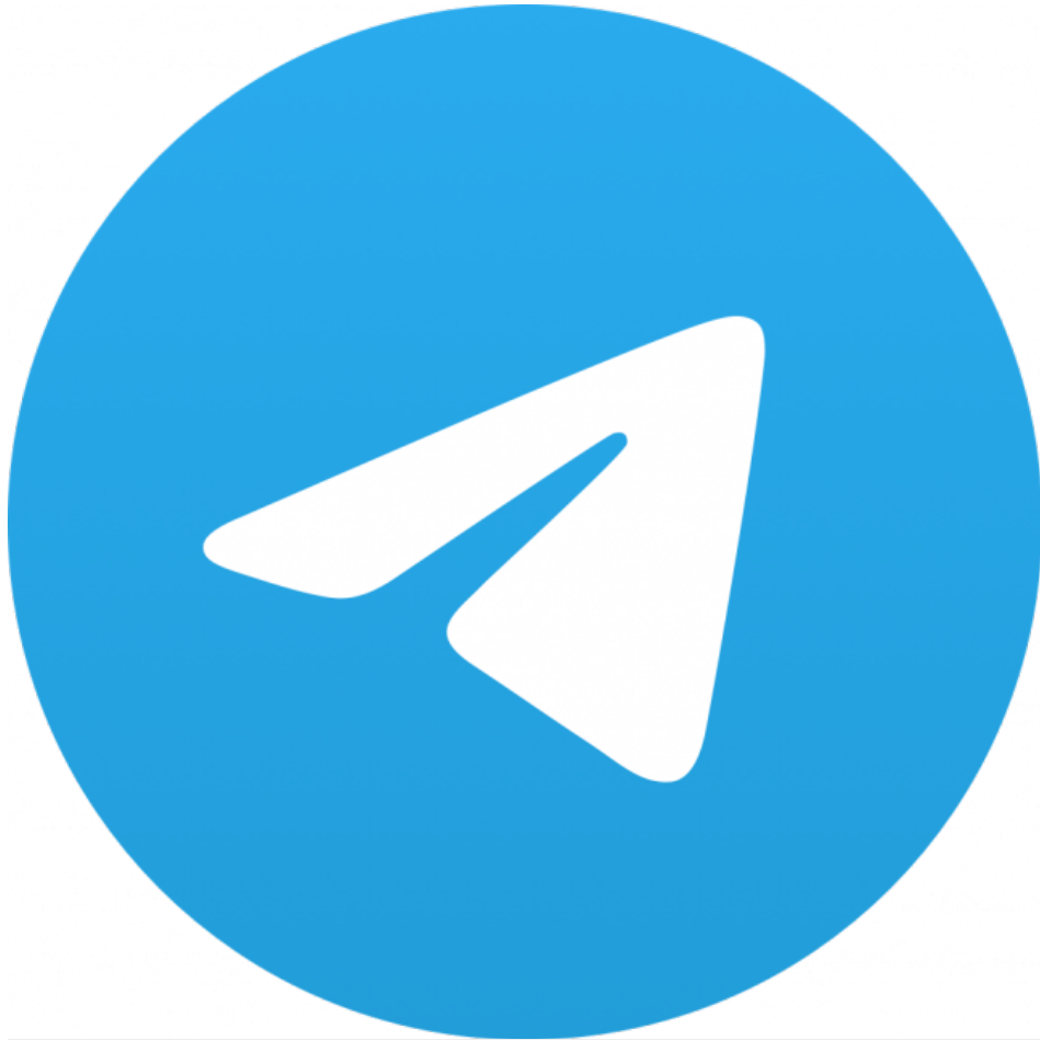
Abb.1: Symbolbild Telegram