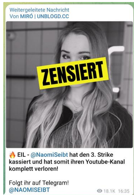
Abb. 4: Aufruf für Naomi Seibt

Mit Bekanntwerden der YouTube-Sperre ging eine Welle der Empörung durch die Reihen ihrer Follower*innen, begleitet von dem vielfach geteilten Aufruf, Naomi Seibt ab sofort auf Telegram zu folgen. Diesen Telegram-Account hatte sie bereits Anfang 2020 eingerichtet und parallel zu Twitter und YouTube bespielt. Der Aufruf war offenbar von Erfolg gekrönt, denn ihr Telegram-Kanal hat derzeit 28.300 Abonnent*innen (Stand: 19.06.2023). Bei einem Vergleich ihrer Feeds auf den verschiedenen Plattformen wird schnell klar, dass sie diese sehr unterschiedlich nutzt. Die aktive Präsenz auf Telegram erfüllt dabei gleich drei besondere Zwecke, die so in keinem anderen sozialen Netzwerk verfolgt werden können: