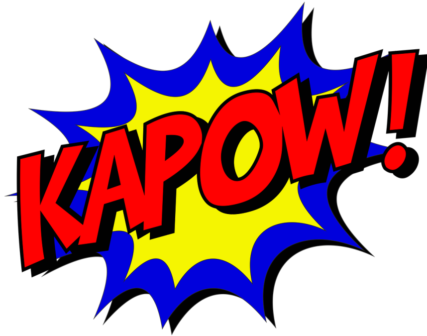
Abb. 1, Symbolbild Konflikt