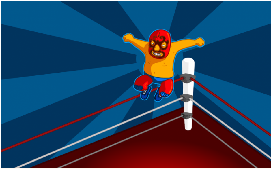
Abb. 12, Symbolbild für Kampf

Die vierte Form der Konfliktaustragung, die hier behandelt werden soll, ist der Kampf. Im Unterschied zu Diskussion, Konkurrenz und Streit ist er die einzige Form, bei der Gewalt im Vordergrund der Konfliktaustragung steht. In digitalen Räumen zeigt sich Kampf oft über Abwertungen und Hass. Shitstorms sind das vielleicht bekannteste Beispiel. Kampf wäre aber beispielsweise auch, wenn versucht wird, den Account der Gegnerin durch ungerechtfertigte Meldungen zu löschen. Das Ziel eines Kampfes ist der Sieg über den Gegner und damit die Demonstration eigener Macht.