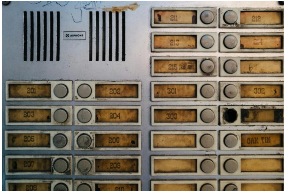
Abb. 5, Je mehr Menschen Teilhabe einfordern, desto mehr Konflikte werden sichtbar

Dass Konflikte entstehen, hat somit zum einen damit zu tun, dass ein Akteur (Individuen, Gruppen, Organisationen) eine Beeinträchtigung, für die er einen anderen Akteur als verantwortlich sieht, nicht länger hinnehmen möchte. Das ist beispielsweise der Fall, wenn Menschen sich durch Sprache diskriminiert fühlen und eine Veränderung einfordern – oder wenn Menschen sich gegen diese Veränderung wehren. Es hat aber ebenso mit den strukturellen Voraussetzungen zu tun, die es ermöglichen, die Beeinträchtigung als Konflikt zu markieren. Denn nur wenn Missstände auch öffentlich angesprochen werden können, werden sie sichtbar.