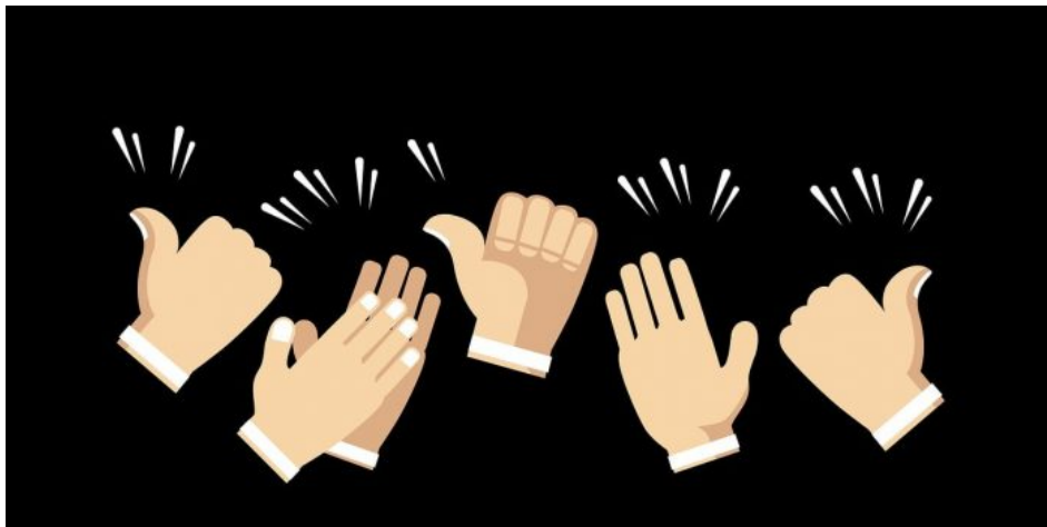
Abb. 11, bei Konkurrenz entscheidet (auch) das Publikum

Konkurrenz und Streit sind weniger formalisiert und sachorientiert, auch wenn sich beide ebenso wie die Diskussion auf Freiwilligkeit beziehen. Hinzu treten ein stärkerer Gruppenbezug und eine größere Emotionalität. Emotionalität steigert sich, weil im Gegensatz zur Diskussion die Sachebene bei der Auseinandersetzung weniger wichtig wird. Neben die Sachebene tritt die Beziehungsebene zwischen den Konfliktparteien. Und über die Beziehungsebene werden Emotionen und Affekte bspw. in Form von Sympathien und Antipathien wichtiger.