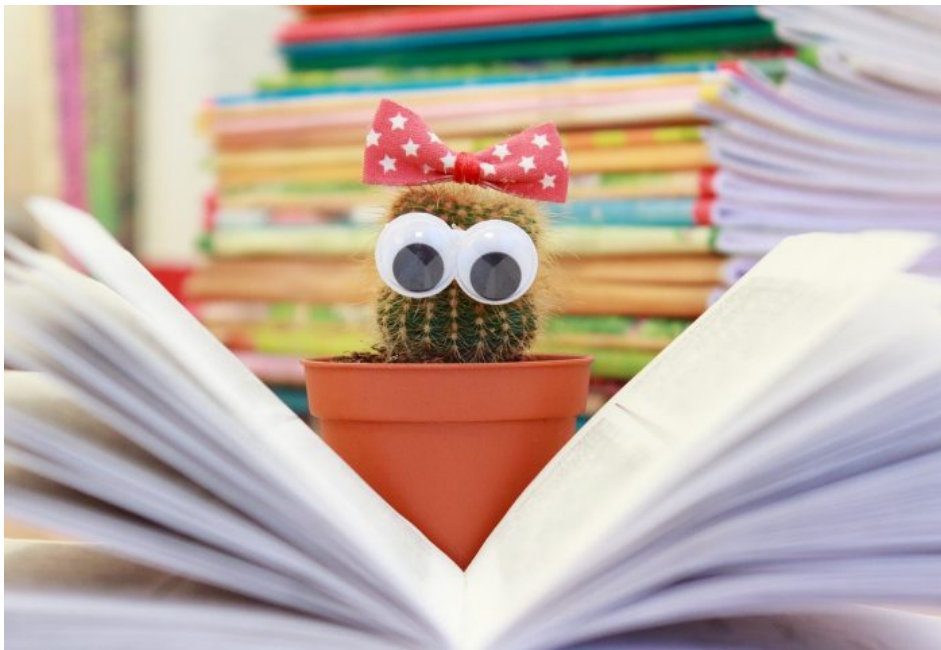
Abb. 6, Symbolbild Konflikte als Entwicklungsaufgabe

„Identität wird hier verstanden als ein permanenter Aushandlungsprozess, in dem das Individuum versucht, über Handlungen/Verhalten eine Übereinstimmung zwischen der eigenen Selbstwahrnehmung und eigenen – antizipierten – Verhaltensstandards zu erhalten (Identitätsarbeit). [...] Das Gelingen dieser Identitätsarbeit bemisst sich für das Subjekt von innen an dem Kriterium der Authentizität und von außen am Kriterium der Anerkennung“ (Keupp 2017).