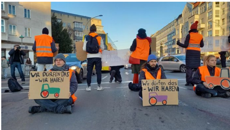
Abb. 7, Demonstration der Letzten Generation in Berlin

In der Selbstdarstellung beschreibt die „Letzte Generation“ ihre Aktionen gegen den Klimawandel als Kampf „gegen den Kollaps unserer Gesellschaft“. Dass ihre Aktionen von großen Teilen der Bevölkerung als Normalitätsverstöße bewertet werden, ist einerseits Teil ihrer Öffentlichkeitsstrategie. Andererseits machen sie damit deutlich, dass die Normalität der Mehrheit für sie selbst einen Normalitätsverstoß darstellt, weil die aus ihrer Sicht so dringend notwendige Klimapolitik nicht umgesetzt wird. An dieser Stelle wird sichtbar, wie unterschiedlich die Vorstellungen von Normalität sein können. Während die Aktivist*innen es für normal / gerechtfertigt halten, auf Basis der wissenschaftlichen Prognosen mit zivilem Ungehorsam den Klimawandel zu bekämpfen, besteht konsequente Klimapolitik für viele andere Menschen aus so vielen Verhaltenszumerkungen , dass die Normalität ihres Lebens sich für sie zu schnell ändern würde.