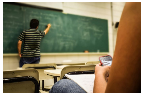
Abb. 2, Symbolbild Bildungsarbeit, Quelle ( https://www.pexels.com/de-de/suche/teacher/ )

Ebenso gibt es Impulse zur Sensibilisierung für mediale Darstellungsweisen, die auf Polarisierung oder Emotionalisierung setzen. Die Expertise soll Anregungen dafür geben, wie Konflikte mithilfe medienpädagogischer Impulse und Methoden mit Jugendlichen zum Thema gemacht werden können. Ziel ist, dass demokratische Prinzipien bei der