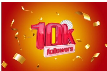
Abb. 3, Symbolbild Follower

In den letzten Jahren kamen Arbeiten hinzu, in denen stärker die gesellschaftspolitische Dimension dieser neuen Öffentlichkeiten betrachtet wurde (z. B. Materna et al. 2021; Reinemann et al. 2019; Wagner/Gebel 2014). Grundlage dafür ist, dass sich mit der Öffentlichkeit auch der politische Diskurs verändert. Aus einer Öffentlichkeit wurden viele verschiedene (Bruns 2023; Hasebrink et al. 2023). In diesen entstehen neue Formen von politischem Aktivismus und neue Formate der politischen Partizipation (Fielitz/Staemmler 2020). Genutzt wurden diese Öffentlichkeiten und Formate jedoch anfänglich vor allem von nicht-etablierten politischen Akteur*innen [1] . So kann der Aufstieg rechtspopulistischer Parteien und anderer extremistischer Gruppierungen auch darauf zurückgeführt werden, dass sie die scheinbar persönlichen Öffentlichkeiten sozialer Netzwerke für ihre Zwecke zu nutzen wussten (vgl. Gäbler 2017; Hillje 2017; Singer/Brooking 2018). Sie bedienen neue Formate, die als jugendaffin bezeichnet werden können. Diese Formate unterscheiden sich in Aufmachung, Sprache und Beteiligungsmöglichkeiten von den konventionellen Formen politischer Aushandlungsprozesse, die oftmals über die Mitgliedschaft in Parteien und die Anwesenheit bei Versammlungen stattfinden. Digitale politische Formate sind im Gegensatz dazu dynamischer und lassen sich leichter in den Alltag integrieren, z. B. wenn es darum geht, Hashtags zu verwenden, digital abzustimmen, Inhalte kollektiv zu liken oder zu melden.