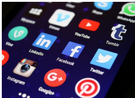
Abb. 4, Symbolbild digitale Vielfalt

Auf diese Weise wurden die unterschiedlichen persönlichen bzw. intimisierten Öffentlichkeiten zu Orten gesellschaftspolitischer Diskussionen. Diese Diskussionen beschäftigen sich in vielen Fällen nicht mit Parteipolitik und werden von jungen Menschen selbst oftmals auch nicht explizit als politisch markiert. Dennoch bestehen sie vielfach aus Aushandlungsprozessen, deren politische Relevanz nicht unterschätzt werden sollte. In der Medienpädagogik wird daher seit Langem mit einem breiten Politikbegriff gearbeitet, der Aushandlungsprozesse allgemein als politisch beschreibt, wenn sie auf die Verhandlung von Fragen des gesellschaftlichen Zusammenlebens abzielen. In vielen Fällen geht es dabei um Machtstrukturen und aus ihnen entstehende Konflikte, die sich im Alltag (nicht nur) von jungen Menschen erfahren lassen. [3] Auf diese Art treten neben die Bilder des eigenen Mittagsmenüs Auseinandersetzungen um Rassismus oder Cancel-Culture. Politisches und Persönliches mischt sich im selben Feed.