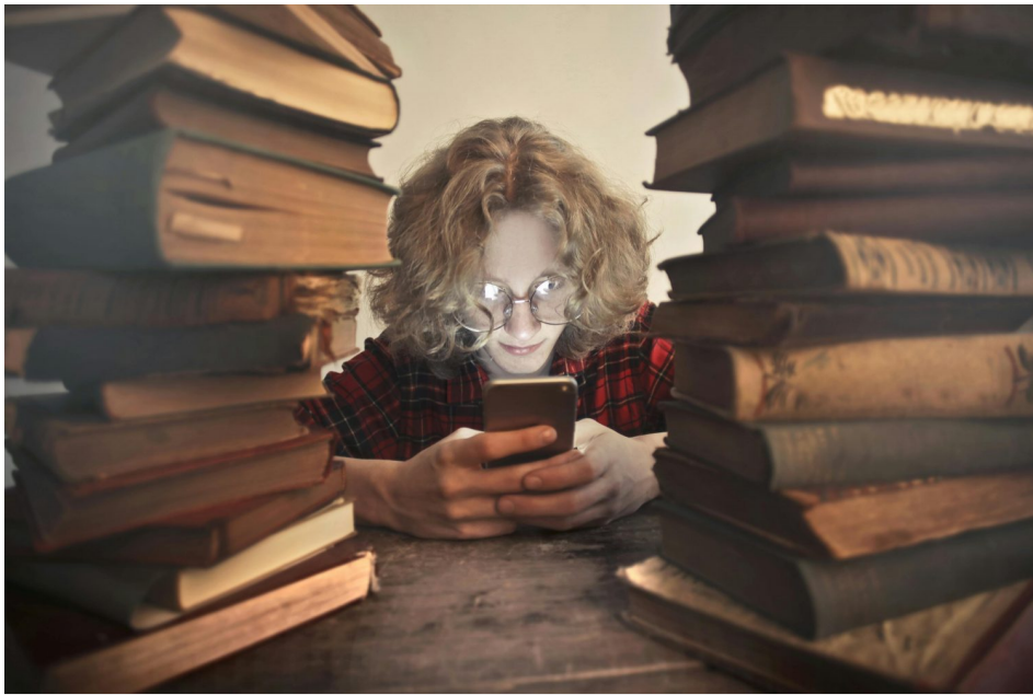
Abb. 1, Wie informieren sich junge Menschen, Quelle