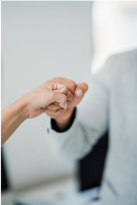
Abb. 13, Symbolbild „Willkommenskultur“

Allerdings verteilen sich die Migrant*innen und migrantischen Deutschen sehr unterschiedlich in Bezug auf Alter und Regionen. In der Bevölkerungskohorte von Menschen im Rentenalter (über 65 Jahre) machen Migrant*innen und migrantische Deutsche ca. 14 Prozent aus, bei den unter 20-Jährigen sind es ca. 38 Prozent und bei Kindern unter fünf Jahren mehr als 42 Prozent. 95 Prozent von ihnen leben in Westdeutschland (inklusive Berlin) und dort vor allem in Großstädten mit starker internationaler Vernetzung wie zum Beispiel Frankfurt am Main (55 Prozent). Insgesamt machen Migrant*innen und migrantische Deutsche 31 Prozent der Bevölkerung in Westdeutschland aus und zehn Prozent der Bevölkerung in Ostdeutschland (El-Mafaalani et al. 2025, 71f.)