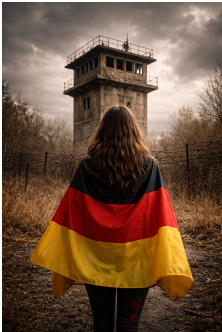
Abb. 3, Symbolbild ypischer #Deutschland-Post in sozialen Medien (ChatGPT)

Wer nach „#Deutschland“ [6] auf TikTok sucht, trifft auf Inhalte wie z. B.: (a) Junge Männer ziehen zum Slogan „deutsche jugend voran [deutsche Fahne][Adler]“ bei hämmerndem Bass durch die Straßen, u. a. kommentiert mit „Es ist Zeit das wir wieder respektiert werden“ [7] (über 333.000 Views und 50.000 Likes); (b) Boxer mit „Germany“-T-Shirt, die auf einen Box-Sack einschlagen.