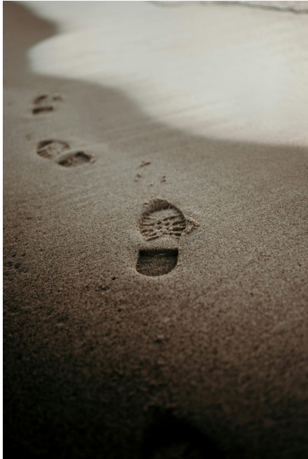
Abb. 5, Symbolbild Normalität

Normen hergestellt, das heißt über Verhaltensweisen, die nicht nur erwartet, sondern auch eingefordert werden, wenn das Gegenüber oder die Bezugsgruppe nicht irritiert werden und ggf. mit Sanktionen reagieren soll.