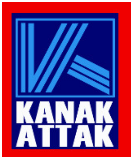
Abb. 11, Logo von Kanak Attak

Parallel zur rechtlichen Anerkennung gab es ein wichtiges kulturelles Engagement migrantischer Deutscher, ihre Stimmen in gesellschaftliche Aushandlungsprozesse einzubringen. Ein frühes Beispiel dafür war Kanak Attak.