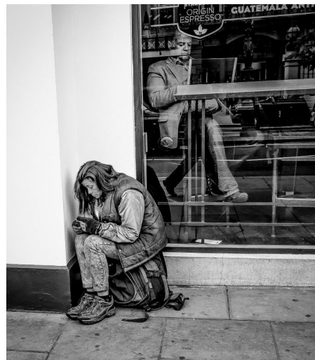
Abb. 9. (un)sichtbare Ungleichbehandlung

„Die oft zu hörende Klage, ‚Bürger zweiter Klasse‘ zu sein [...], hat vermutlich [...] mit einer sozialstrukturellen Unterprivilegierung [zu tun]. [...] Im Vergleich beider Teilgesellschaften ist Westdeutschland mittelschichtiger, Ostdeutschland hingegen eine einfache Arbeitsnehmersgesellschaft, ja ein ‚Land der kleinen Leute‘. Eine Schicht der Wohlhabenden hat sich nur in Ansätzen etabliert, die innerdeutsche ‚Vermögensmauer‘ ragt weiterhin steil empor. Das Vermögen der Haushalte ist in Westdeutschland doppelt so hoch, nur zwei Prozent der Erbschaftsteuer werden in Ostdeutschland (ohne Berlin) gezahlt. [...] Zudem hatte die Transformationsphase dann eine ganz eigene Auswirkung auf die soziale Lagerung und Milieubildung in Ostdeutschland. Massenhafte Arbeitslosigkeit, Deindustrialisierung in der Fläche, Erfahrungen der beruflichen Deklassierung [...] haben dazu beigetragen, dass sich die nach unten nivellierte Sozialstruktur der DDR nicht nach oben entfaltete, sondern tendenziell zusammengestaucht blieb“ (Mau 2024, 22f.)