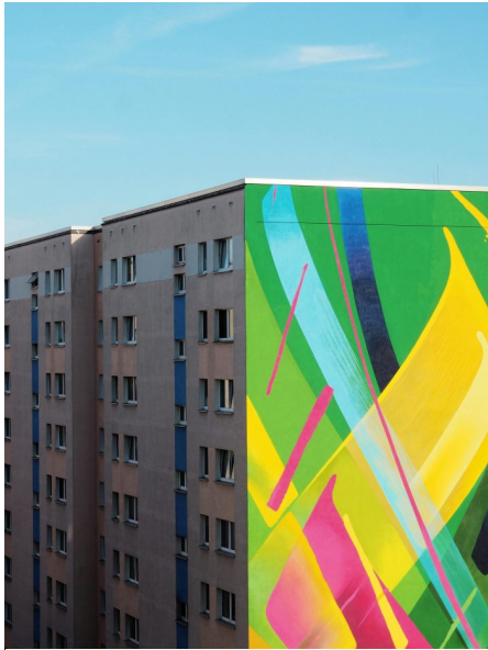
Abb. 7, Symbolbild ostdeutsche Diversität