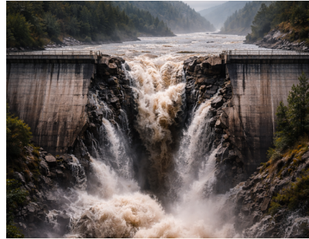
Abb. 14, Entgrenzungsbefürchtung: Furcht davor, dass der Damm bricht; KI-generiert (ChatGPT)

Die ostdeutschen Bundesländer waren nach dem Fall der Mauer in ihrer Bevölkerungsstruktur ähnlich homogen wie Westdeutschland nach dem Zweiten Weltkrieg. Erfahrungen mit den Herausforderungen einer Einwanderungsgesellschaft waren kaum verbreitet. Die Nachwendezeit war dann geprägt von einer massiven wirtschaftlichen, kulturellen und gesellschaftlichen Transformation. Migrant*innen kamen zunehmend auch in die ostdeutschen Bundesländer, gleichzeitig gab und gibt es dort aber wesentlich weniger migrantische Deutsche.