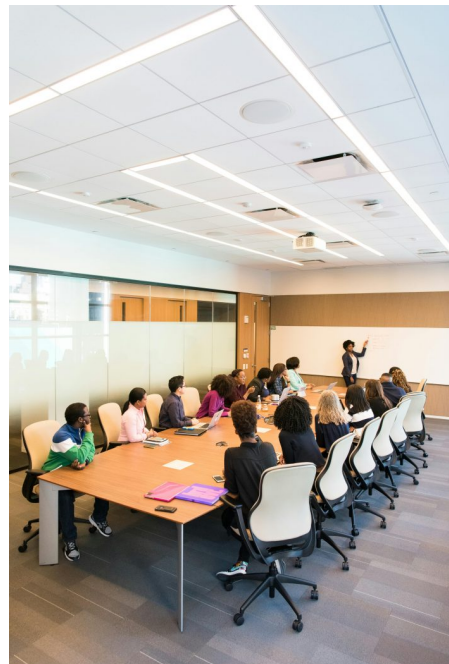
Abb. 6, Symbolbild für einen akademischen Workshop