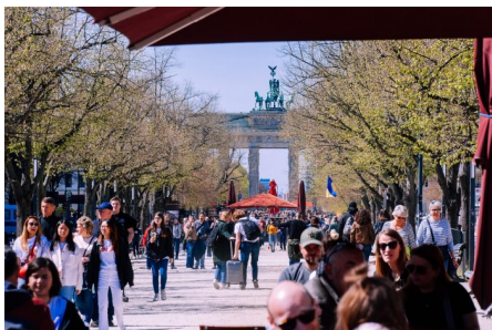
Abb. 2, Großstädte sind durch eine diverse Bevölkerung geprägt Quelle ( https://pixabay.com/de/photos/berlin-menge-brandenburger-tor-7162999/ )

Ein besonders breites Spektrum gewinnt diese Aushandlung in Social Media. Welche medialen Erscheinungsformen es in der Diskussion ums Deutschsein gibt (Kapitel 1), wie sie sozial- und politikwissenschaftlich gefasst werden kann (Kapitel 2), welche Triggerpunkte dabei bedient werden (Kapitel 3) und wie sich medienpädagogisch dazu arbeiten lässt (Kapitel 4) – das sind die Themen des vorliegenden Textes.