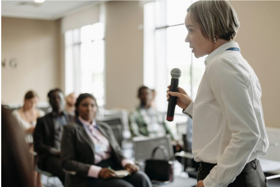
Abb. 8, deutsche Dominanzkultur als selbstverständlicher Teil der Gesellschaft

gemacht, zu Deutschen zweiter Klasse. [16]