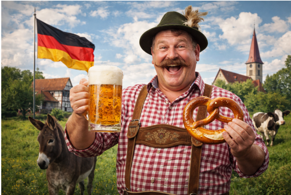
Abb. 1, Symbolbild "Deutschsein", KI-generiert (ChatGPT)

Ein besonders breites Spektrum gewinnt diese Aushandlung in Social Media. Welche medialen Erscheinungsformen es in der Diskussion ums Deutschsein gibt (Kapitel 1), wie sie sozial- und politikwissenschaftlich gefasst werden kann (Kapitel 2), welche Triggerpunkte dabei bedient werden (Kapitel 3) und wie sich medienpädagogisch dazu arbeiten lässt (Kapitel 4) – das sind die Themen des vorliegenden Textes.