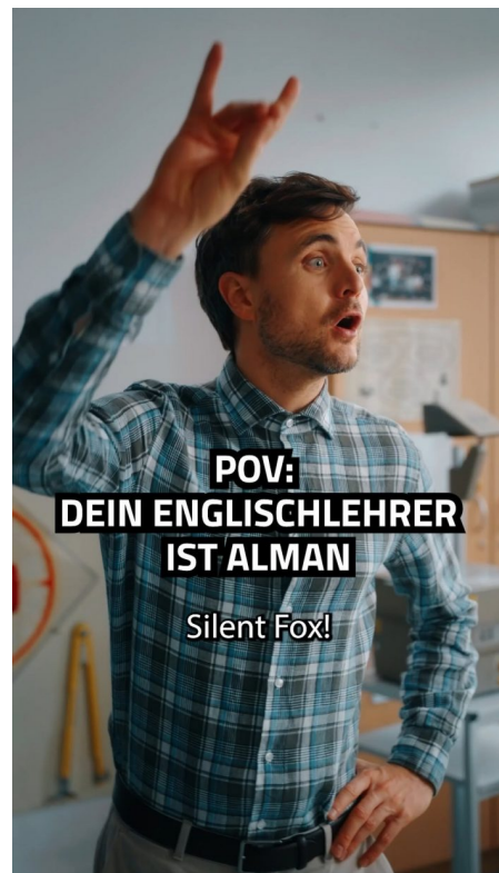
Abb. 4, Influencer Phil Laude als „Alman“

Deutschseins. Gemein ist ihnen jedoch, dass sie sich auf ein Deutschsein beziehen, das als normal und gegeben (bzw. zu verteidigen oder wiederherzustellen) vorausgesetzt wird.