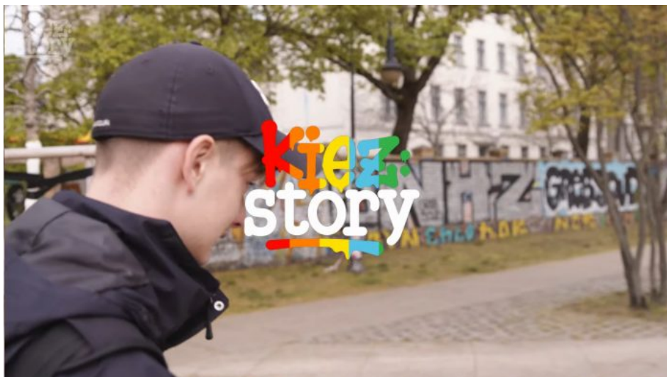
Abb. 17, Foto aus dem YouTube-Video ‚Ich, Krieg, Krise! mit Daniil‘ Quelle ( https://www.youtube.com/watch?v=5Cg2CkX9N3w )

Ein wichtiges Modellprojekt im Themenfeld ist ‚kiez:story‘, das von 2020 bis 2024 von ufuq.de mit einem Schwerpunkt in Berlin umgesetzt wurde.