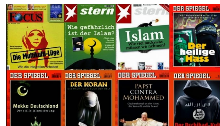
Abb. 2: Titel mit Islambezug von deutschen Magazinen

So finden sich in Medienberichten nach wie vor viele Klischees: „Der“ Islam wird beispielsweise häufig mit Frauenunterdrückung und Gewalt in Verbindung gebracht. Verbreitet ist auch die Annahme, der Islam kenne generell keine Trennung zwischen Religion und Politik. Die Folge davon ist immer wieder eine pauschale Verbindung von Islam mit radikalem Fundamentalismus, Extremismus und Terrorismus. Dabei ist das Problem weniger, dass das Berichtete sachlich falsch wäre, sondern eher eine fehlende Ausgewogenheit zwischen positiver und negativer Berichterstattung. Dies schlägt sich auch in Einstellungen in der Bevölkerung gegenüber „Muslim*innen“ nieder (Hafez 2009, S. 102–105; Schiffer 2013, S. 126–127; Schneider et al. 2013, S. 5; Mediendienst Integration 2019, S. 109–111).