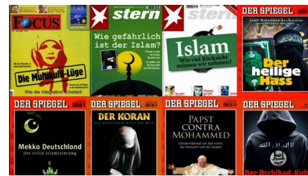
Abb. 2: Titel mit Islambezug von deutschen Magazinen

So finden sich in Medienberichten nach wie vor viele Klischees: „Der“ Islam wird beispielsweise häufig mit Frauenunterdrückung und Gewalt in Verbindung gebracht. Verbreitet ist auch die Annahme, der Islam kenne generell keine Trennung zwischen Religion und Politik. Die Folge davon ist immer wieder eine pauschale Verbindung von Islam mit radikalem Fundamentalismus, Extremismus und Terrorismus. Dabei ist das Problem weniger, dass das Berichtete sachlich falsch wäre, sondern eher eine fehlende Ausgewogenheit zwischen positiver und negativer Berichterstattung. Dies schlägt sich auch in Einstellungen in der Bevölkerung gegenüber „Muslim*innen“ nieder (Hafez 2009, S. 102–105; Schiffer 2013, S. 126–127; Schneider et al. 2013, S. 5; Mediendienst Integration 2019, S. 109–111).