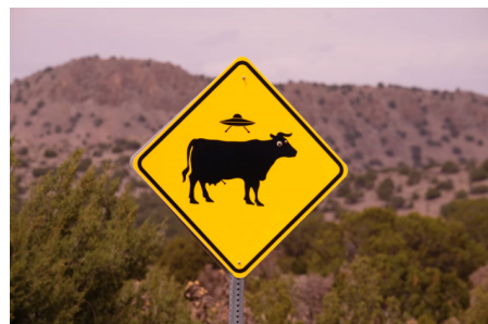
Abb. 2: Unerwartete Gäste

Schlimmstenfalls ist am Ende nicht mehr gewonnen als eine willkürliche Sammlung potenziell problematischer Aussagen. Wenn sich Pädagog*innen hier mehr abverlangen als sie leisten können, droht zudem die Gefahr, dass auch menschenverachtende oder antidemokratische Inhalte unwidersprochen im Raum stehen bleiben. Es ist also ratsam, die eigenen pädagogischen Ziele stets im Blick zu behalten und im Zweifel lieber am plakativen Beispiel zu arbeiten und sich auf das Wesentliche zu beschränken.