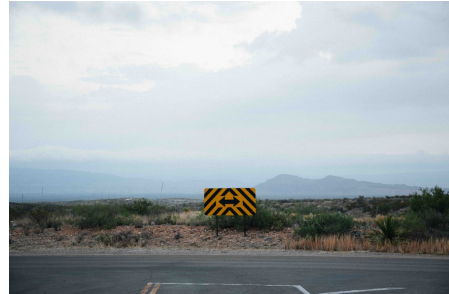
Abb. 4: Orientierung ist nicht immer einfach

Für ein tieferes Verständnis sind die psychologischen Mechanismen und Funktionen mit in den Blick zu nehmen. Schließlich stellt sich doch die Frage, welchen Mehrwert Menschen eigentlich davon haben, sich verschwörungstheoretischer Deutungen zu bedienen. Dabei gilt zu verstehen: Die besondere Attraktivität des Verschwörungsdenkens basiert darauf, dass es dem Individuum Halt und Sinnstiftung verspricht, wo eine immer komplexer werdende Welt und auch sonst oft schwer durchschaubare gesellschaftliche Zusammenhänge Verunsicherung, Ohnmachtsgefühle und Kontrollverlust auslösen. Es entlastet, wenn man für Dinge, die man als bedrohend oder ungerecht empfindet, nicht nur eine scheinbar logische Erklärung finden, sondern auch konkrete Verantwortliche benennen kann. Zu denjenigen zu gehören, die den Durchblick haben, erhöht das Gefühl eigener Bedeutsamkeit und steigert den Selbstwert. Das Lernen über Verschwörungsideologien sollte also nicht nur als rein kognitive Vermittlung von Sachwissen verstanden werden, sondern die emotionale Dimension des Themas mitberücksichtigen.