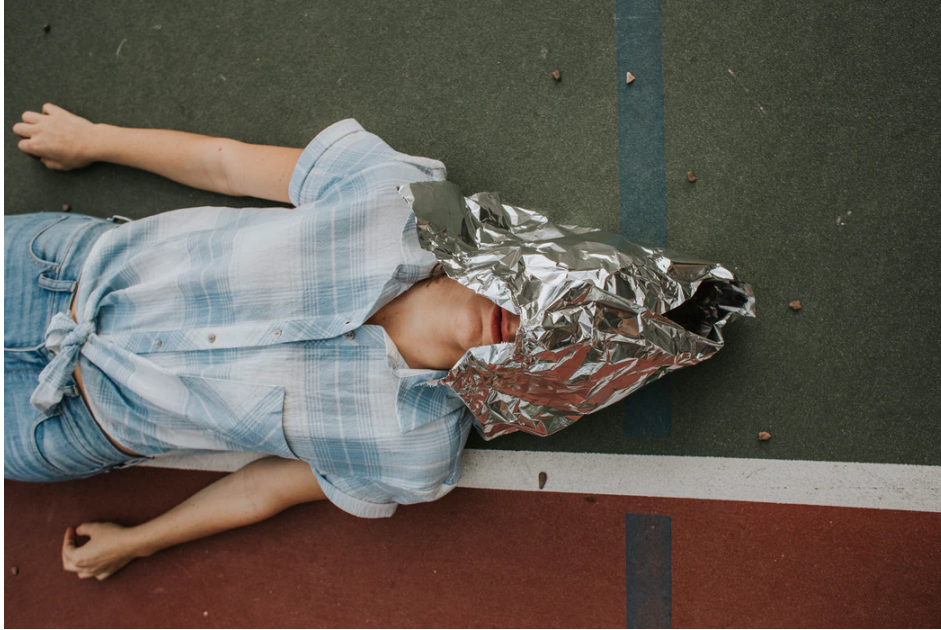
Abb. 1: Aluhüte schützen vor Regen, aber nicht vor Irrtümern.