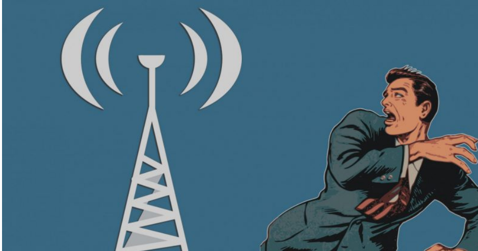
Abb. 3: Verschwörungstheoretiker*innen propagieren einen Zusammenhang zwischen 5G und der Verbreitung von Corona.

Nicht umsonst dienen Verschwörungstheorien auch als Radikalisierungsbeschleuniger. Pädagog*innen sollten hier genau hinhören, nachfragen, sensibel sein, um Jugendlichen alternative Wege der Weltdeutung aufzuzeigen. Vor dem Hintergrund der politischen Implikationen ist ein pathologisierender Sprachgebrauch zu vermeiden, denn Verschwörungsgläubige einfach als „Verrückte“ oder „Spinner“ abzutun, wird dem Gegenstand nicht gerecht. Es sind keineswegs nur verwirrte Sonderlinge, die Verschwörungstheorien glauben und verbreiten, sondern auch politische Akteure, die darin entweder ihre ideologische Weltansicht untermauert sehen oder ein willkommenes Werkzeug für politische Propaganda finden.