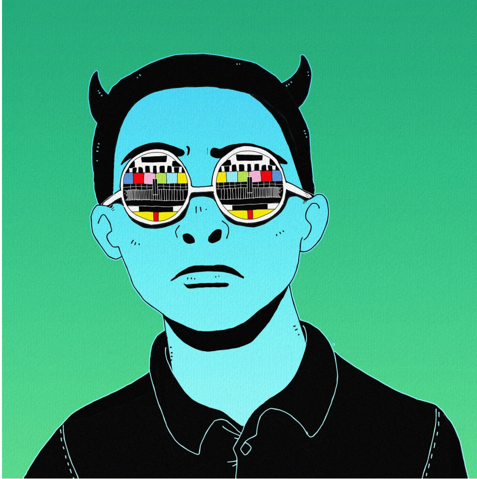
Abb. 1: Verschwörungstheoretiker verteufeln Politiker, Medien, Wissenschaftler, kurz: alle „die da oben“