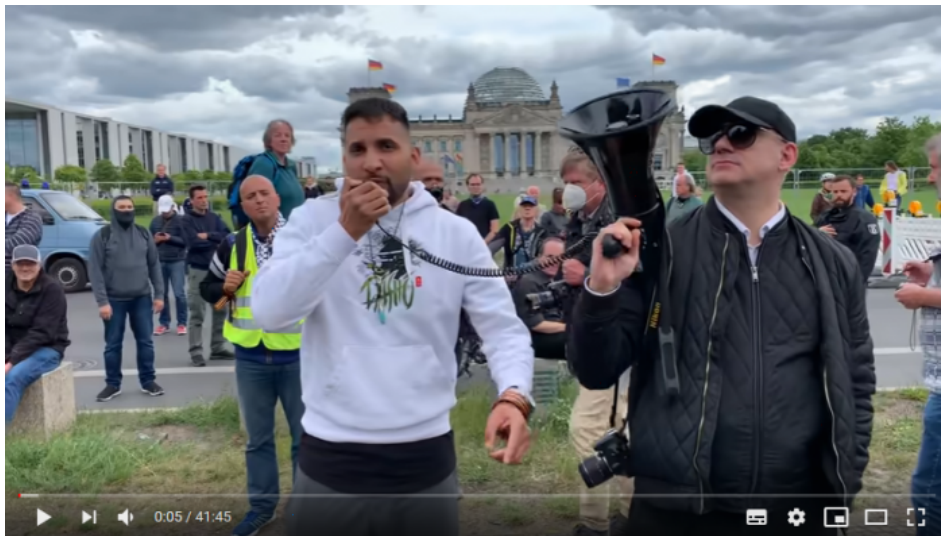
Abb. 2: Attila Hildmann bei einer Demonstration vor dem Reichstag.

Das Ganze betrifft auch andere Promis. Zum Beispiel Attila Hildmann, im früheren Leben veganer Koch, heute die vielleicht prominenteste Leitfigur abstruser Denkweisen. Auf Telegram versammelt er Menschen um sich, denen er statt veganer Gerichte konspirative Denkweisen serviert. Deutschland nach Hildmann? Mittlerweile Diktatur und kurz vor dem Bürgerkrieg! Der Koch postet Fotos von sich mit Samuraischwert oder Sturmgewehr und ruft seine Follower auf, mit ihm in den Untergrund zu gehen. Und sie alle zur Rechenschaft zu ziehen – Merkel, Bill Gates, Drosten und wie sie alle heißen.