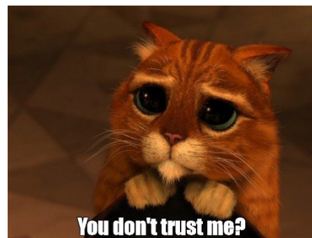
Abb. 4: Wie man die Vertrauensbasis stärken kann

Mehr Erfolg verspricht das Gespräch mit Menschen aus unserem direkten Umfeld, wenn uns merkwürdige Aussagen auffallen. Hier kann man nachhaken, wenn die Argumentation komisch wird. Wir alle hören eher auf Menschen, die uns als Menschen wichtig sind, weil wir sie persönlich kennen. Und zwar egal worum es geht. Daher ist Gegenrede, Argumentieren, Sichtweisen tauschen dort besonders sinnvoll, wo man sich menschlich nahesteht. Nicht selten ist das Verbreiten von Verschwörungstheorien ein Schrei nach Aufmerksamkeit oder eine Provokation, hinter der vor allem eine Nachricht steht: „Bitte höre mir zu!“ Oft brauchen Verschwörungstheoretiker*innen einfach nur Aufmerksamkeit und Anteilnahme.