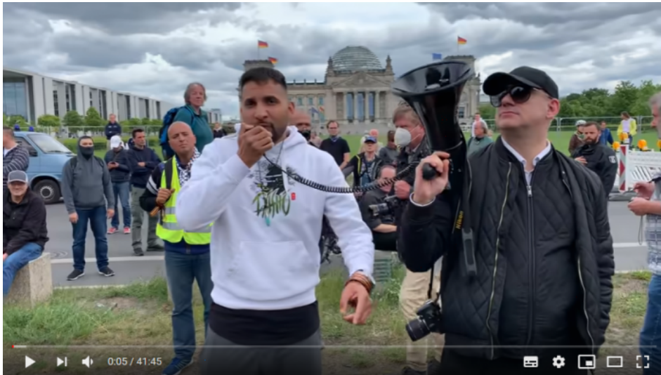
Abb. 2: Attila Hildmann bei einer Demonstration vor dem Reichstag.

Das Ganze betrifft auch andere Promis. Zum Beispiel Attila Hildmann, im früheren Leben veganer Koch, heute die vielleicht prominenteste Leitfigur abstruser Denkweisen. Auf Telegram versammelt er Menschen um sich, denen er statt veganer Gerichte konspirative Denkweisen serviert. Deutschland nach Hildmann? Mittlerweile Diktatur und kurz vor dem Bürgerkrieg! Der Koch postet Fotos von sich mit Samuraischwert oder Sturmgewehr und ruft seine Follower auf, mit ihm in den Untergrund zu gehen. Und sie alle zur Rechenschaft zu ziehen – Merkel, Bill Gates, Drosten und wie sie alle heißen.