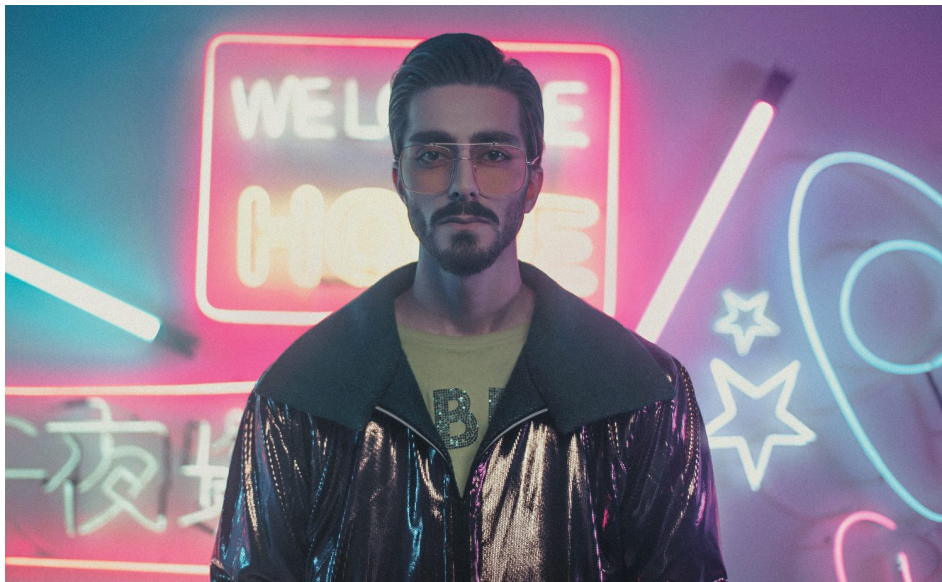
Abb. 1, Individuell vor Leuchtkreklame