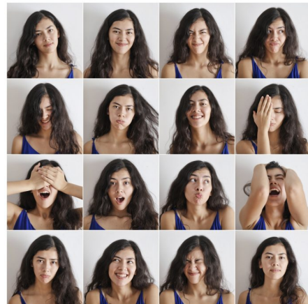
Abb. 3, Ich bin viele, viele sind ich

Ein weiterer Weg, nicht alleine man selbst sein zu müssen, sind religiöse Gemeinschaften. Das mag seltsam klingen, weil lange angenommen wurde, dass religiöse Gemeinschaften in individualisierten Gesellschaften an Bedeutung verlieren würden. Aber Religionen sind anpassungsfähig. So haben es beispielsweise buddhistische Gruppierungen, viele christliche Kirchen und muslimische Gemeinschaften geschafft, mit der Individualisierung ihrer Gläubigen umzugehen. Auch wenn sich nicht alle theologischen Inhalte verändert haben, wurden Wege gefunden, Angebote für sehr unterschiedliche Lebenswege zu bieten. Zum Beispiel wurden Scheidungen möglich gemacht, Rollenbilder von Mann und Frau ( https://rise-jugendkultur.de/artikel/gender-im-netz-zwischen-vielfalt-und-tradition/ ) flexibler oder religiöse Pflichten teilweise weniger verpflichtend.