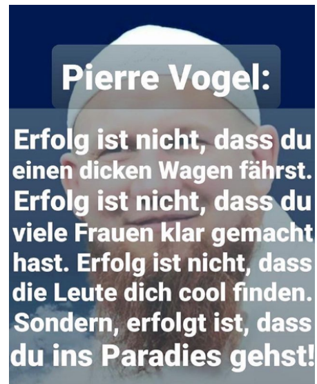
Abb. 4, An Ratgebern mangelt es nicht

Ein Beispiel dafür sind manche salafistische Gruppierungen. Diese behaupten von sich, den Islam so zu leben, wie es die Nachfolger des Propheten Mohammed taten. Sie stellen sich gegen individuelle Auslegungen der Schriften und Gebote des Islams. Extremistische salafistische Strömungen bekämpfen mitunter Abweichungen von dem Ideal, das sie als richtig bezeichnen, indem sie Andersgläubigen ihre Religion absprechen oder sogar Gewalt gegen sie ausüben. Ihre Positionen hören sich manchmal an, als ob sie aus einer anderen Zeit stammen. Dabei sind auch salafistische Gruppen tief in der Gegenwart verankert ( https://rise-jugendkultur.de/artikel/hizb-ut-tahrir-islamismus-als-dritter-weg/ ). Wer den Lebensweg heute bekannter Salafist*innen anschaut, sieht, dass dieser auch für sie sehr individuelle Herausforderungen enthalten hat. Ihre Lösung war es, sich zurückzuziehen und die Gegenwart abzulehnen. Ihr Versprechen ist es, dass alle, die es so machen wie sie – wohlgemerkt: nur so wie sie – die richtigen Wege an den Kreuzungen des Lebens nehmen.