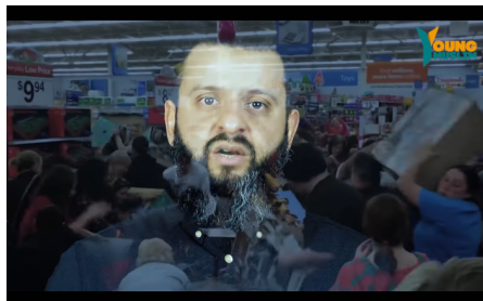
Abb. 2, Szenen eines Schlussverkaufes im Hintergrund visualisieren das Narrativ der Konsumkritik, Quelle: Young Muslim

Verbunden wird die Argumentation mit dem Aufruf, die Ausnahmesituation der Pandemie zur religiösen Bewährung zu nutzen. Dieses Motiv findet sich in vielen der analysierten Videos. Die Sprecher*innen adressieren die Unsicherheit der Menschen, um ihnen die religiösen Heilsversprechungen der islamistischen Gruppierungen nahezulegen. Ein weiteres Beispiel dafür ist das Video „#Coronavirus in Deutschland – Die pure Wahrheit“ auf dem Kanal Young Muslim . Im Video geht es über Kultur- und Konsumkritik ( https://rise-jugendkultur.de/expertise/gesellschaftskritik/gesellschaftskritische-narrative/kapitalismus-und-globalisierungskritik/ ) hin zum Glauben daran, dass die Krise zur Bewährung genutzt werden sollte (siehe Abb. 2).