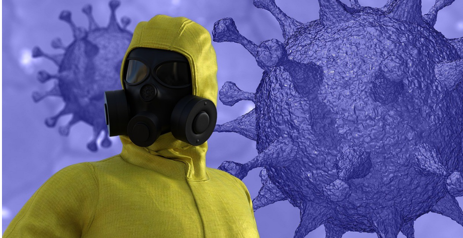
Abb. 1, Symbolbild für Coronakrise

Im Fokus dieses Beitrags steht die Frage, wie die Coronakrise in islamistischen und rechtspopulistischen YouTube-Accounts thematisch aufgegriffen wurde [1] Dafür wurden in einem qualitativen Sample 50 Videos aus zehn islamistischen Kanälen und 38 Videos aus sieben rechtspopulistischen Kanälen analysiert. [2] In die Analyse einbezogen wurden alle Videos, die in den ausgesuchten Kanälen die Begriffe Corona, Covid-19, Virus und/oder Quarantäne im Titel führten und zwischen dem 1. Januar und dem 8. Mai 2020 auf die jeweiligen YouTube-Kanäle hochgeladen wurden. Die Reichweite der Videos im Sample war beachtlich. Die ins Sample einbezogenen islamistischen Kanäle hatten insgesamt 494.200 Abonnent*innen, die dazugehörigen Videos 623.189 Aufrufe und insgesamt 3.934 Kommentare [3] Die rechtspopulistischen Kanäle kamen auf 835.300 Abonnent*innen, die ausgewerteten Videos auf 7.005.104 Aufrufe und 54.174 Kommentare (jeweils Stand 29.06.2020).