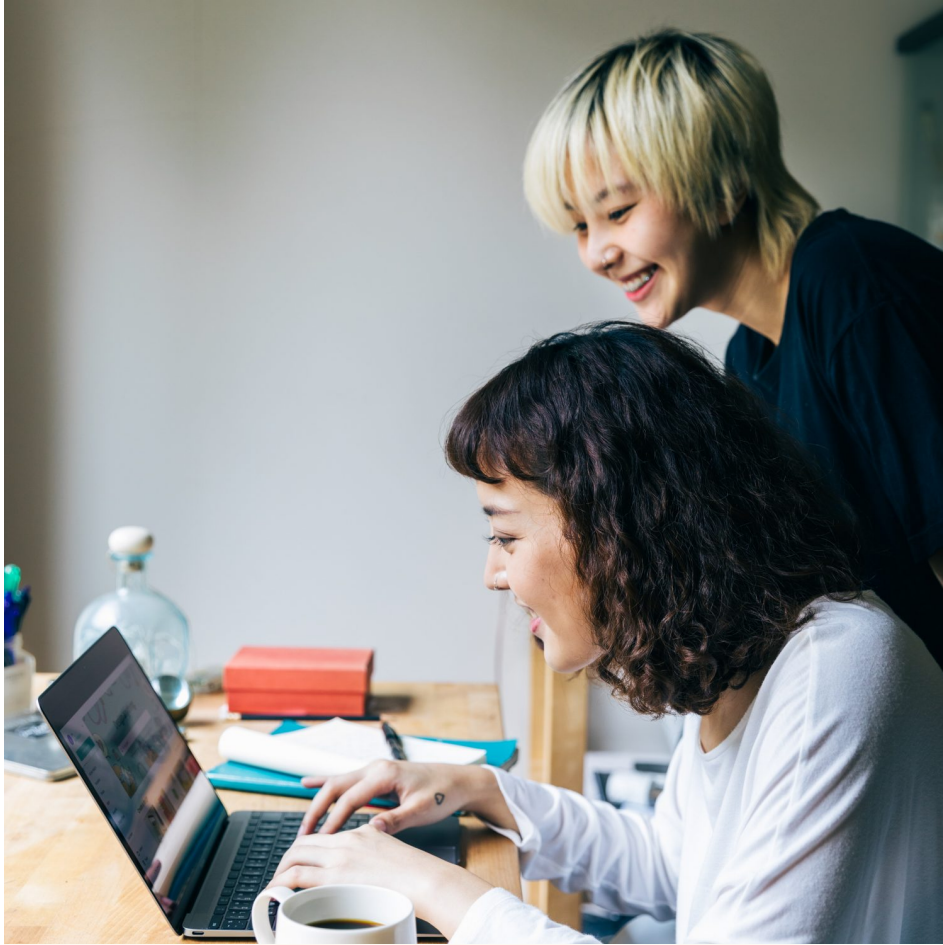
Abb. 1, Das Internet ist für junge Muslim*innen unterschiedlich wichtig