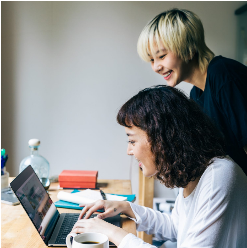
Abb. 1, Das Internet ist für junge Muslim*innen unterschiedlich wichtig