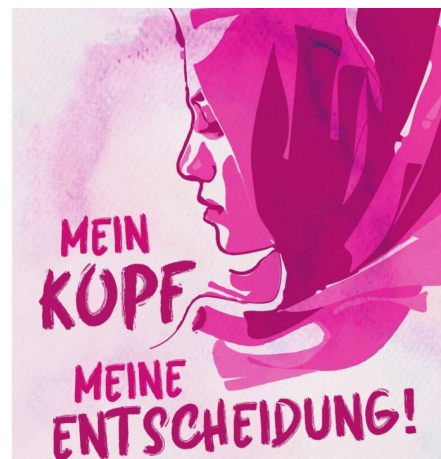
Abb. 4, Die Kampagne #NichtOhneMeinKopftuch nutzt soziale Medien, um Diskriminierungserfahrungen zu instrumentalisieren, Quelle: Islamischer Zentralrat, Twitter.

Die Internetangebote adressieren gezielt junge Muslim*innen. Thematisiert und instrumentalisiert werden Erfahrungen mit Rassismus, Ausgrenzung und Diskriminierung ( https://rise-jugendkultur.de/material/wo-begegnet-uns-rassismus/ ). Hierbei wird häufig ein dichotomes Weltbild erzeugt, in dem die Muslim*innen stets Opfer und der Staat der Aggressor ist (Schmitt 2019). Bekannt wurde „Generation Islam“ mit seiner Kampagne #NichtOhneMeinKopftuch, die 2017 und 2018 eine hohe Wirkweite erzielte und in mehr als 70.000 Twitter-Beiträgen aufgegriffen wurde. Hintergrund waren Debatten um Kopftuchverbote in Deutschland und Österreich (Schmitt 2019). Ähnliche Aktivitäten gehen auch von „Realität Islam“ aus. Auch diese Organisation kann im Umfeld der HuT verortet werden. Beide Initiativen zeigen, welche Breitenwirkung ein Online-Islamismus ( https://rise-jugendkultur.de/artikel/boah-krasser-content/ ) bei jungen Muslim*innen entfalten kann.