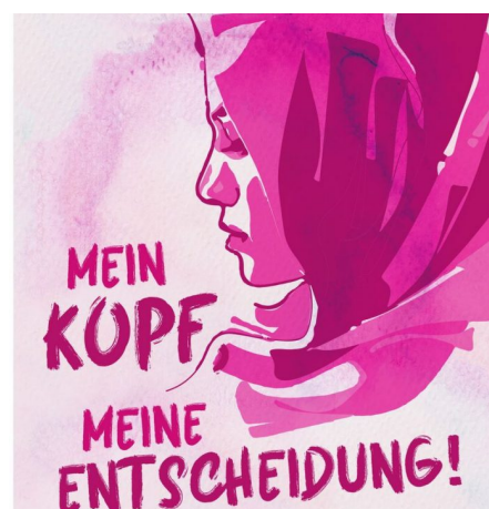
Abb. 4. Die Kampagne #NichtOhneMeinKopftuch nutzt soziale Medien, um Diskriminierungserfahrungen zu instrumentalisieren, Quelle: Islamischer Zentralrat, Twitter.

Die Internetangebote adressieren gezielt junge Muslim*innen. Thematisiert und instrumentalisiert werden Erfahrungen mit Rassismus, Ausgrenzung und Diskriminierung ( https://rise-jugendkultur.de/material/wo-begegnet-uns-rassismus/ ). Hierbei wird häufig ein dichotomes Weltbild erzeugt, in dem die Muslim*innen stets Opfer und der Staat der Aggressor ist (Schmitt 2019). Bekannt wurde „Generation Islam“ mit seiner Kampagne #NichtOhneMeinKopftuch, die 2017 und 2018 eine hohe Wirkweite erzielte und in mehr als 70.000 Twitter-Beiträgen aufgegriffen wurde. Hintergrund waren Debatten um Kopftuchverbote in Deutschland und Österreich (Schmitt 2019). Ähnliche Aktivitäten gehen auch von „Realität Islam“ aus. Auch diese Organisation kann im Umfeld der HuT verortet werden. Beide Initiativen zeigen, welche Breitenwirkung ein Online-Islamismus ( https://rise-jugendkultur.de/artikel/boah-krasser-content/ ) bei jungen Muslim*innen entfalten kann.