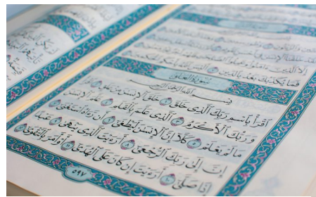
Abb. 3, Jugendliche mit fundamentaler Orientierung gestalten ihren Alltag streng nach religiösen Vorgaben.

Die Jugendlichen haben in der Regel die Bildungsangebote der Moscheegemeinden durchlaufen und verfügen häufig über sehr gute Kenntnisse der islamischen Religion und eine enge Anbindung an die Moscheegemeinden. Aus diesem Umfeld stammen auch Studierende, die z.B. an der Universität Osnabrück Islamische Theologie studieren. Viele Gespräche mit Studierenden zeigten, dass sie islamische Inhalte im Internet sehr kritisch betrachten, da diese häufig auf islamistische Kontexte verweisen. [2] Sie halten die klassische Bildungsarbeit der Gemeinden nach wie vor für zentral. Onlineangebote spielen für sie eine untergeordnete Rolle.