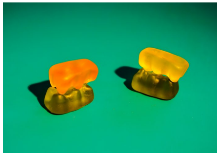
Abb. 2, Sexualität als zentraler Bestandteil der Identitätsbildung

Sexualität spielt gerade in der Jugendphase eine wichtige Rolle, denn die Geschlechtsreife entwickelt sich in dieser Phase und damit auch ein neues Lebensgefühl. Die körperlichen Veränderungen bringen Neugier und viele Fragen mit sich. Sexualität und sexuelle Selbstbestimmung sind zentrale Werte der geschlechtlichen Identitätsbildung ( https://rise-jugendkultur.de/glossar/geschlechtsidentitaet/ ).