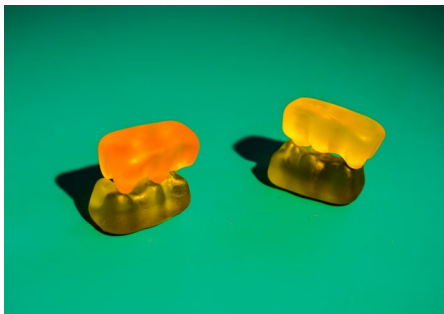
Abb. 2, Sexualität als zentraler Bestandteil der Identitätsbildung

Sexualität spielt gerade in der Jugendphase eine wichtige Rolle, denn die Geschlechtsreife entwickelt sich in dieser Phase und damit auch ein neues Lebensgefühl. Die körperlichen Veränderungen bringen Neugier und viele Fragen mit sich. Sexualität und sexuelle Selbstbestimmung sind zentrale Werte der geschlechtlichen Identitätsbildung ( https://rise-jugendkultur.de/glossar/geschlechtsidentitaet/ ).