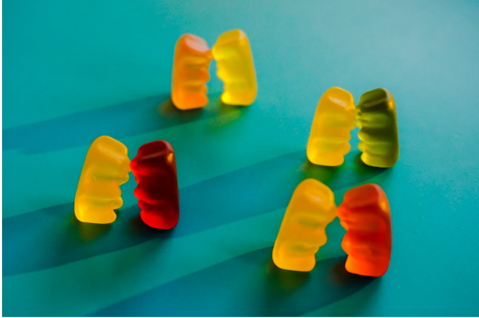
Abb. 1, Wie lassen sich die Einstellungen junger Muslim*innen zu Sexualität beschreiben?

Muslim*innen hatten bis ins 19. Jahrhundert ein relativ offenes Verhältnis zur Sexualität. Dann hat sich allerdings ein Wandel vollzogen, der bis heute spürbar ist. Ein Grund hierfür ist, dass durch den Kolonialismus eine prude Sexualmoral in muslimisch geprägte Gesellschaften Einzug gehalten hat. Aber auch die Ideologisierung des Islam hat dazu beigetragen, wie Ali Ghandour in der Auseinandersetzung mit verschiedenen muslimischen und literarischen Quellen zeigen kann (https://rise-jugendkultur.de/artikel/muslimische-sexualethik-ist-pluralistisch/) (vgl. Ghandour 2019). Vor dem 18. Jahrhundert haben muslimische Gelehrte sowohl den Koran kommentiert als auch ausführlich über Erotik geschrieben, wie zum Beispiel der Gelehrte Dschalal ad-Din as-Suyuti.