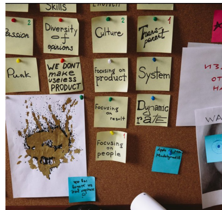
Abb. 2, Politische Bildung benötigt eine kritische Herangehensweise

Menschen zu empowern, muss mit ihren Inhalten und Formaten die Voraussetzungen dafür schaffen, dass Menschen fundierte Meinungen und Positionen entwickeln können. Dafür braucht es Wissen und Sensibilität über und für historische und aktuelle gesellschaftliche und politische Prozesse und Entscheidungen. Es braucht historische und aktuelle Kenntnisse über lokale und globale Strukturen und Machtverhältnisse und es braucht die unterschiedlichen Perspektiven und Positionen der an den Prozessen Beteiligten, damit nicht nur auf Narrativen der eigenen Perspektiven Positionen entwickelt werden.