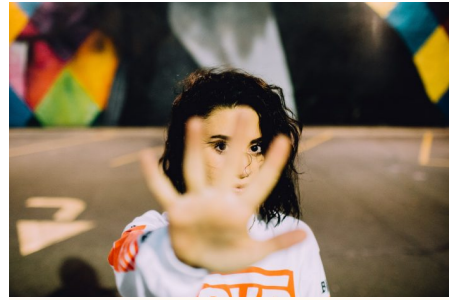
Abb. 3, Politische Bildung soll Gesellschaften nicht kategorisieren

von Bedeutung sein, sie reproduziert damit aber auch zumeist die Konstruktion gesellschaftlicher Gruppen auf Basis äußerer Merkmale. Eine diverse und inklusive politische Bildung muss versuchen, diese Kategorisierungen zu verlernen. Wenn wir unsere Gesellschaft immer wieder mit neuen Adjektiven versehen – sei es, um die Vielfalt in ihr darzustellen oder ganz Sarrazin-like diejenigen in parallele Gesellschaften zu stecken, die nicht zur eigentlichen Gesellschaft gehören sollen – markieren wir immer wieder diejenigen als die anderen .