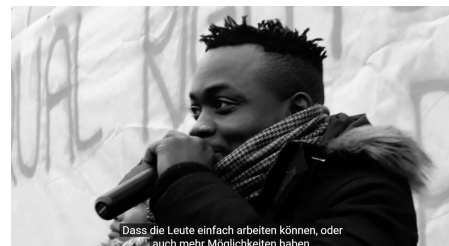
Abb. 2, Szene einer Kundgebung in „Schau mir in die Augen“.

So beschreibt beispielsweise der Film „Schau mir in die Augen“ die persönliche Geschichte eines Geflüchteten, der in Brandenburg lebt. Im Film werden gesellschaftliche Missstände aufgezeigt, die durch die Erfahrungen des Protagonisten deutlich werden. Darüber hinaus erzählt der Film jedoch auch von den persönlichen Strategien seiner Protagonist*innen: über ihren Umgang mit ihrer neuen Lebenssituation, die Versuche, die eigenen Ressourcen zu stärken, und die Bedeutung von Solidarität.