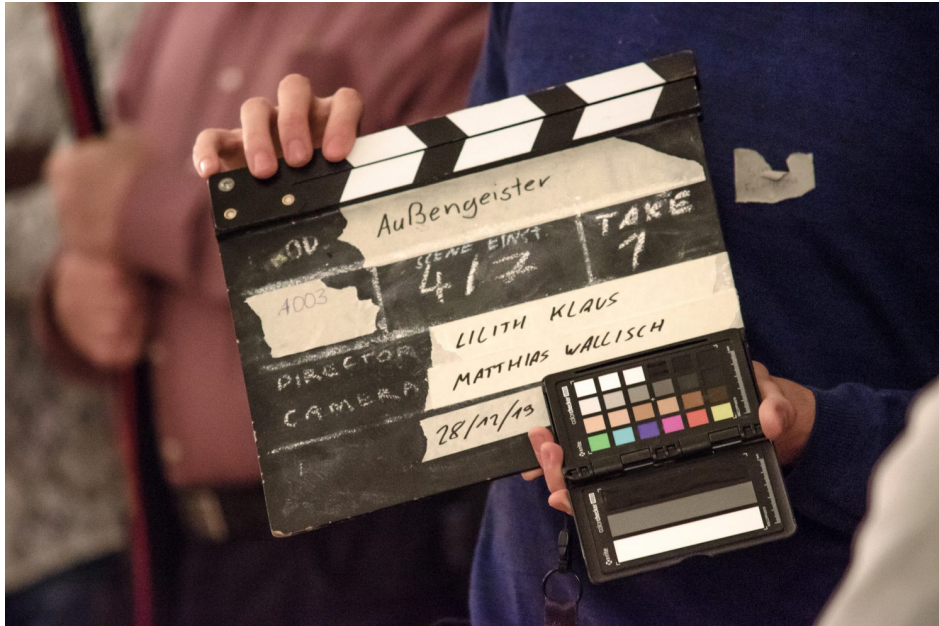
Abb. 1, Am Set von "Außengeister". Eine Produktion gefördert von RISE.

Extremistische Gruppierungen nutzen soziale Medien, um über ihre Anhänger*innen hinaus gezielt ein größeres Zielpublikum anzusprechen (Nordbruch 2018). Die Inhalte der Accounts extremistischer Gruppierungen weisen ein breites inhaltliches Spektrum auf. Neben explizit extremistischen Inhalten, die zu Gewalt aufrufen oder Symbole verbotener Organisationen beinhalten, gibt es viele subtile, lebensweltnahe Angebote, in denen Erfahrung mit Rassismus, Fragen zur religiösen Lebensführung oder das Verhalten in der Corona-Pandemie thematisiert werden (Frankenberger et al. 2019). [1] Bewegtbildformate spielen dabei eine wichtige Rolle. So hat beispielsweise der YouTube -Kanal von Generation Islam über 40.000 Abonnent*innen. In den Videos geht es um religiöse Fragen, aber auch um Kommentare zum Zeitgeschehen. Die Reichweite der Videos ist mit über 4 Millionen Aufrufen (Stand Dezember 2020) beträchtlich.