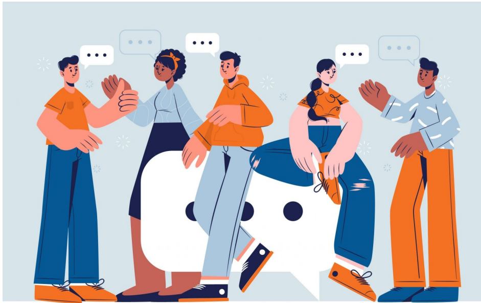
Abb. 1

Jugendliche wachsen gegenwärtig in einer Welt auf, in der sie einfach und direkt einen Zugang zu einer Fülle an Informationen haben. Über ihr Smartphone und soziale Medien wie YouTube , TikTok , Instagram und Facebook können sie Informationen jederzeit und überall nicht nur empfangen, sondern auch bewerten und