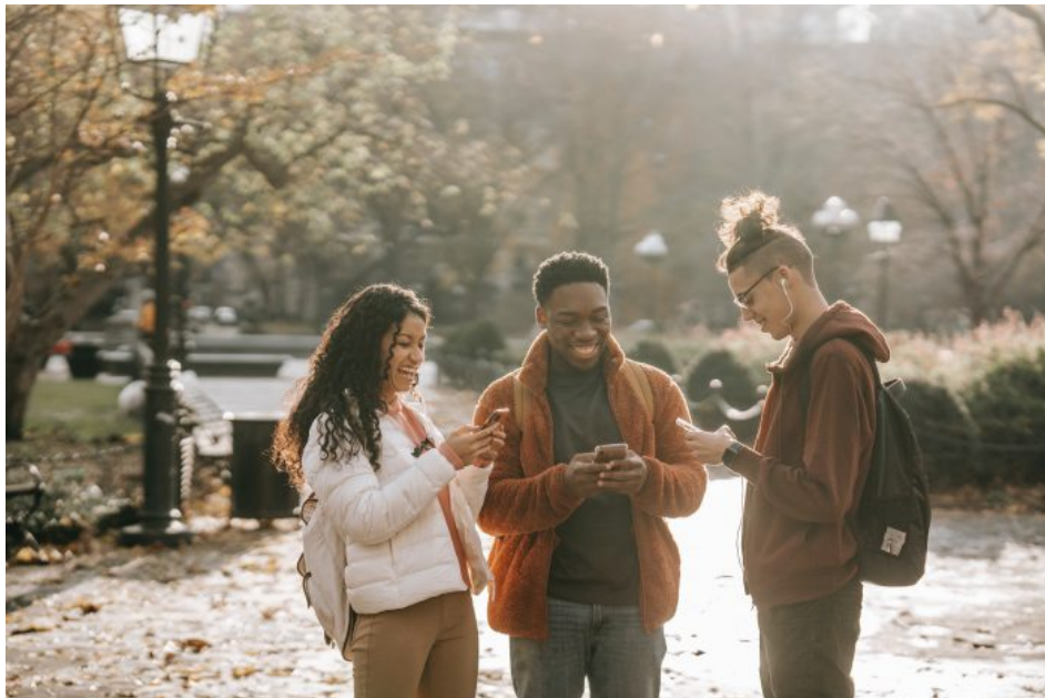
Abb. 3, Gruppenloyalität kann zu einer Schweigespirale führen

Ein weiterer Wertekonflikt wird sichtbar, wenn man die zeitlichen Ressourcen eines Mediennutzenden in den Blick nimmt: Sich differenziert zu informieren, kostet Zeit, und diese ist in der beschleunigten Lebenswirklichkeit ein knappes Gut. Sensationelle und emotionalisierende Meldungen können, weil sie Aufmerksamkeit auf sich ziehen und schneller konsumierbar sind, in Konkurrenz zu Informationsvielfalt und Informationstiefe stehen. Die algorithmenbasierte Vorschlagsfunktion in sozialen Medien wie YouTube sorgt zudem dafür, dass sich die Nutzer*innen immer spektakulärere Videos in Folge ansehen. Es wird ihnen damit schwer gemacht, sich gegen eine solche angetriggerte Sensationssuche zu wehren.