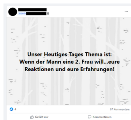
Abbildung 3, Beispiel einer abendlichen Diskussionsrunde der Facebookgruppe, Quelle: Facebook