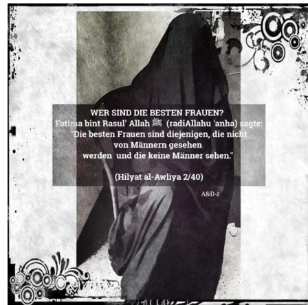
Abbildung 2, Beispiel für den Versuch, die Geschlechtertrennung und Verhüllung von Frauen als einzig islamisch korrekte Art der Lebensführung darzustellen

Themen können z.B. die aus ihrer Sicht einzig islamisch korrekte Kleidung muslimischer Frauen, die gottgegebene Rolle der Muslimin als Hausfrau und Mutter oder die vermeintlichen Vorteile einer islamischen Mehrehe sein. Um den besonderen Stellenwert der Frau im Islam zu betonen, bezeichnen sie muslimische Frauen oft als „Herrin des Haushalts“, welche die Familie umsorgt und die Gemeinschaft der Muslim*innen im Glauben stärkt. Plurale Entwürfe von Geschlecht oder anderweitige Lebensentwürfe setzen sie dagegen zugunsten traditioneller Geschlechterbilder herab. Ihre klaren Statements zu Wertvorstellungen und Rollenverteilungen bieten schnelle und einfache Antworten und vermitteln Halt.