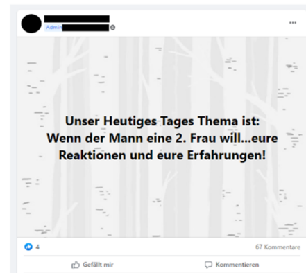
Abbildung 3, Beispiel einer abendlichen Diskussionsrunde der Facebookgruppe