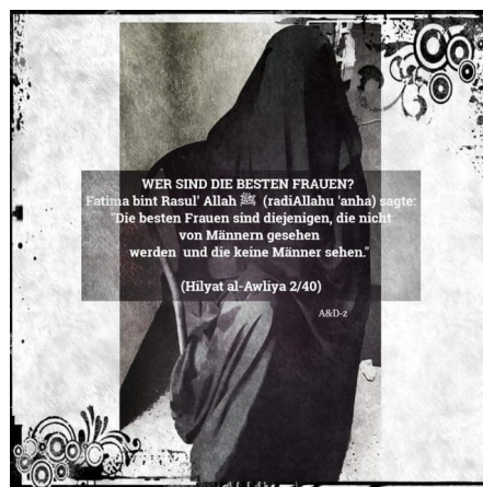
Abbildung 2, Beispiel für den Versuch, die Geschlechtertrennung und Verhüllung von Frauen als einzig islamisch korrekte Art der Lebensführung darzustellen

Themen können z.B. die aus ihrer Sicht einzig islamisch korrekte Kleidung muslimischer Frauen, die gottgegebene Rolle der Muslimin als Hausfrau und Mutter oder die vermeintlichen Vorteile einer islamischen Mehrehe sein. Um den besonderen Stellenwert der Frau im Islam zu betonen, bezeichnen sie muslimische Frauen oft als „Herrin des Haushalts“, welche die Familie umsorgt und die Gemeinschaft der Muslim*innen im Glauben stärkt. Plurale Entwürfe von Geschlecht oder anderweitige Lebensentwürfe setzen sie dagegen zugunsten traditioneller Geschlechterbilder herab. Ihre klaren Statements zu Wertvorstellungen und Rollenverteilungen bieten schnelle und einfache Antworten und vermitteln Halt.