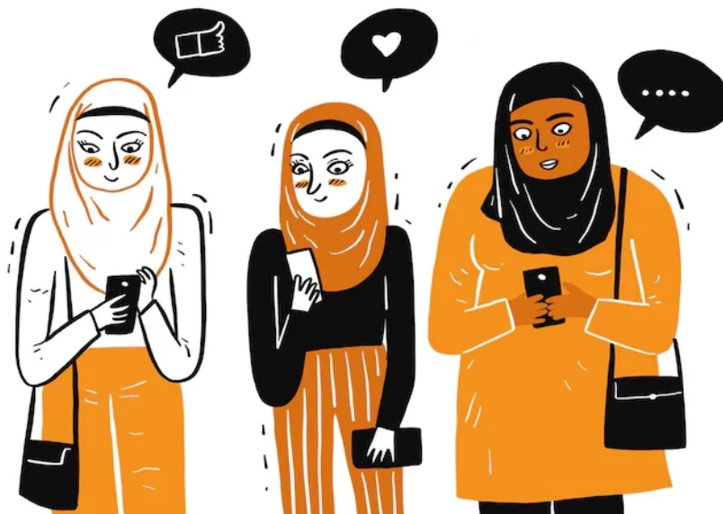
Abbildung 1, Symbolbild: Muslimische Frauengruppe in sozialen Medien

von Nina Nowar (Erlanger Zentrum für Islam und Recht in Europa, FAU Erlangen-Nürnberg)